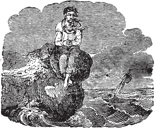
para kay xyza